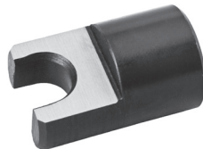
Für Typ • For Type 43**