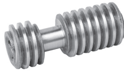
Für Typ • For Type 43**